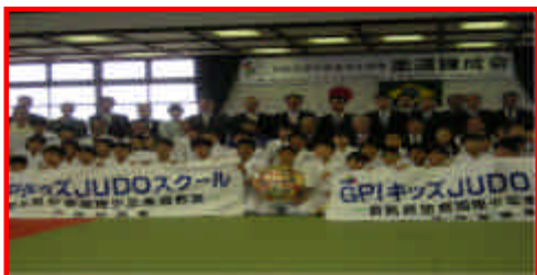
金色の必勝だるまを中心に記念撮影

群馬県警察では、日本人と外国人の双方が、共に安全に安心して暮らせるまちづくりを目指し、色々な活動を行っています。今後は、本紙を活用し、防犯、交通安全等の各種情報をお知らせしますので是非ご活用下さい。