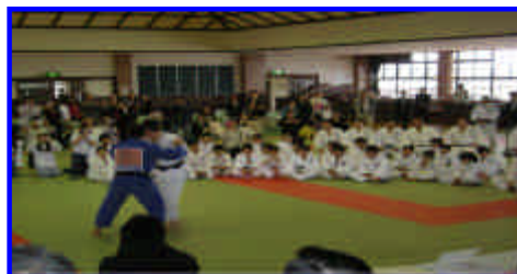
金メダリストとの合同練習

本年3月30日、日本人ブラジル移住100周年を記念して、太田市武道館において日伯交流年記念共生対策「柔道錬成会」を開催しました。(主催 群馬県警察)