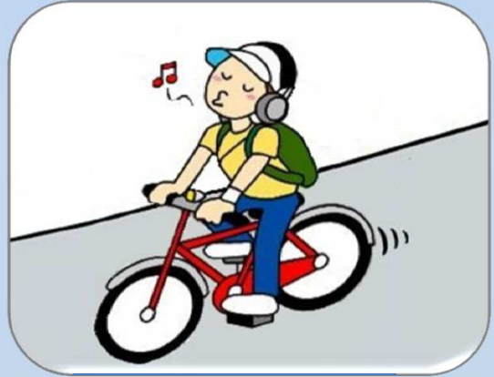
ブレーキのない自転車運転