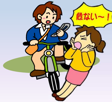
わき見運転等の安全 運転義務違反で事故