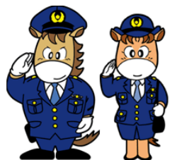
上州くん みやまちゃん

日頃より、防犯活動にご協力いただき、ありがとうございます。 群馬県では、178団体約1,000台（令和元年末現在）の青色防犯パトロール車が活動しています。